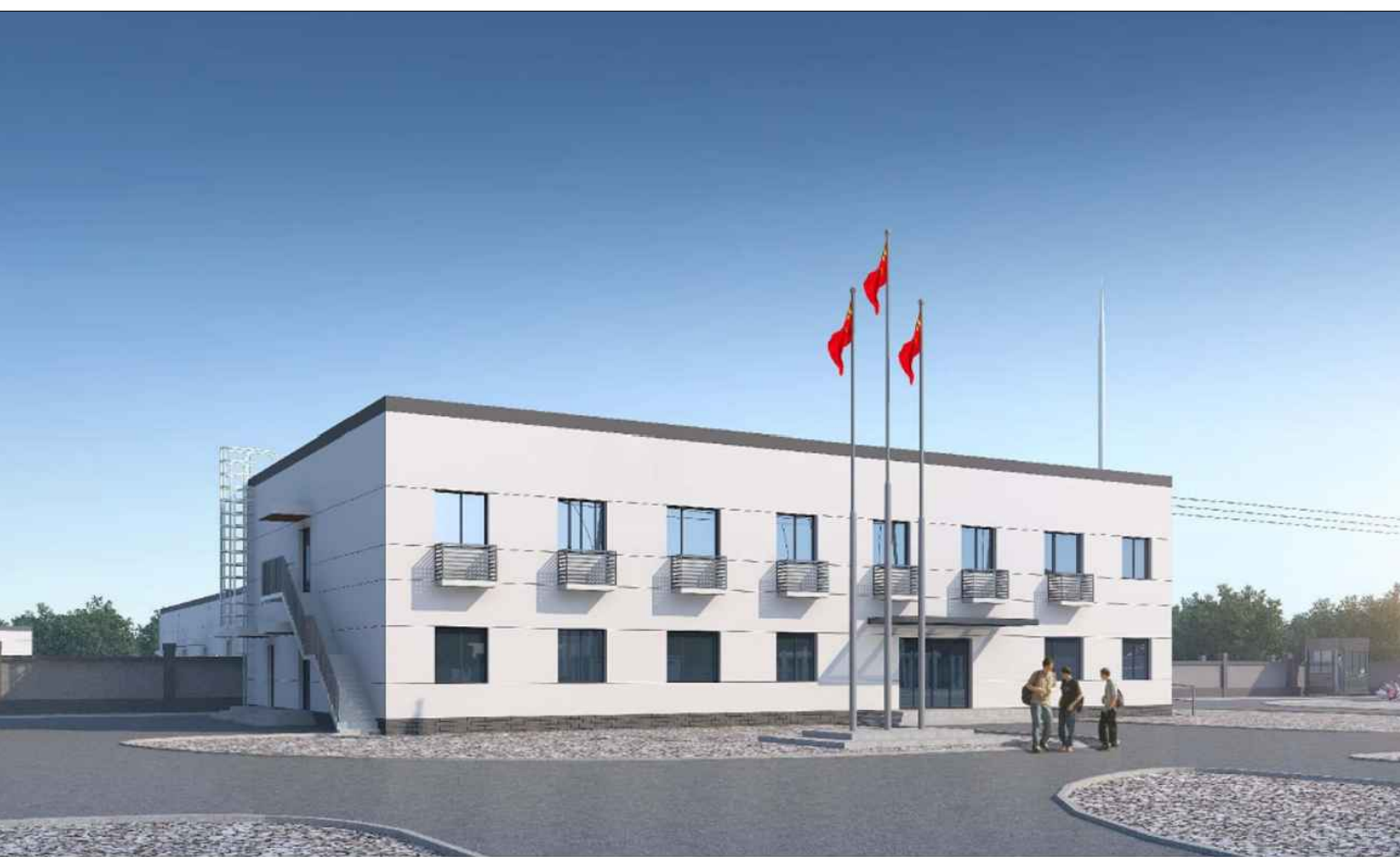
生产运维楼透视图