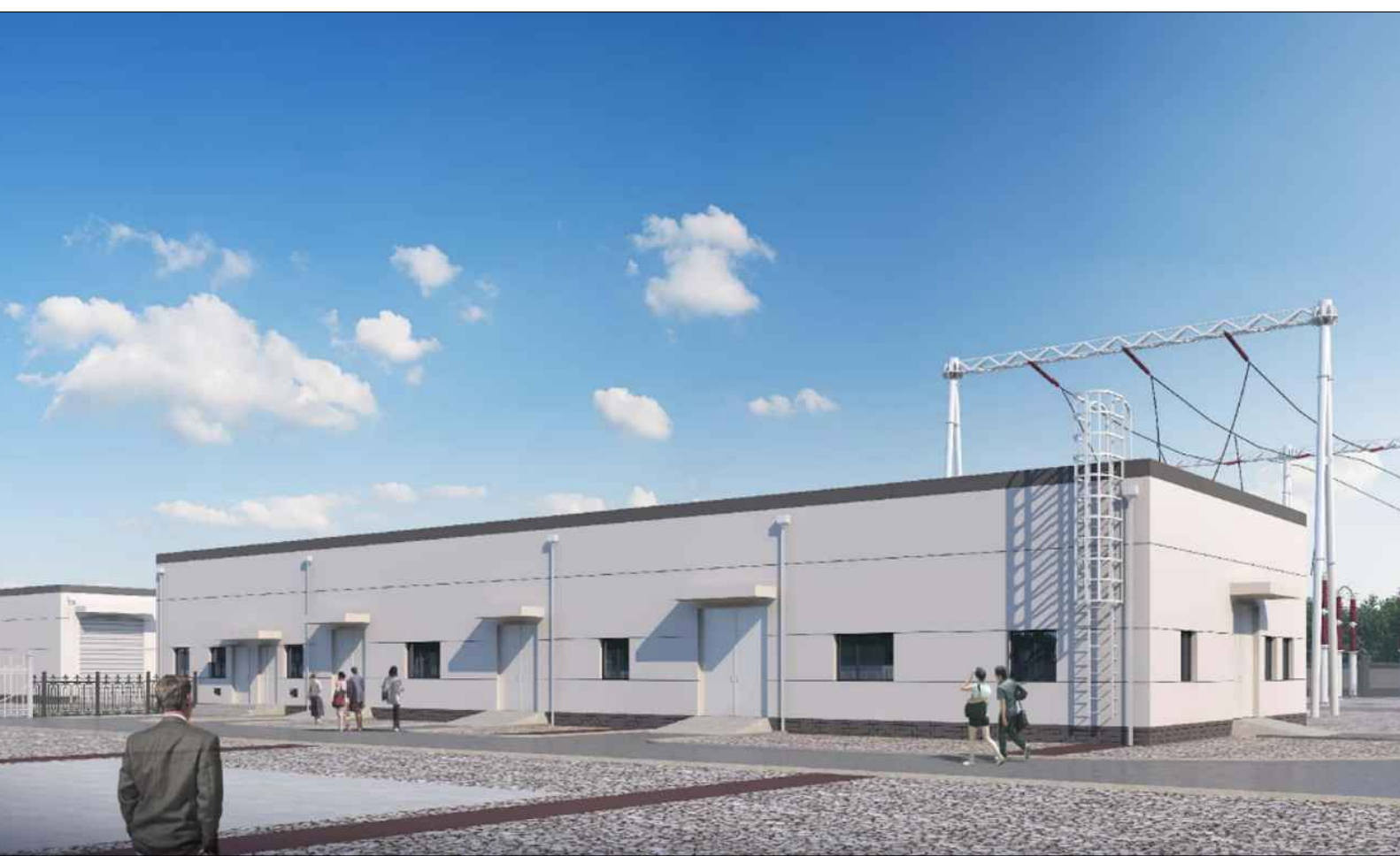
配电装置楼透视图